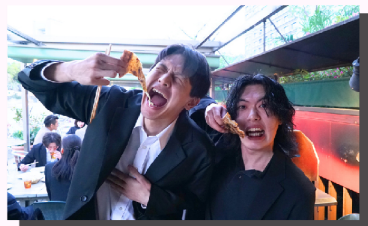
熱い研修の後は、待ちに待ったBBQ! オフィスを離れた開放的な空間の中で、研修中とはまた違うリラックスした表情があちこちで見られました。

普段は業務で関わることの少ないメンバー同士も交流を深め、お互いの新たな一面や魅力を知るきっかけとなりました!