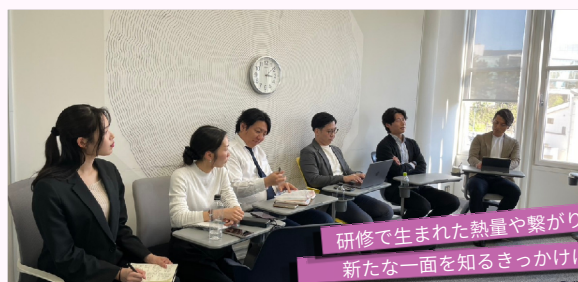
研修で生まれた熱量や繋がりが 新たな一面を知るきっかけに!

今回の挑戦は全メンバー参加の「ものがたりプレゼン会」。役職や社歴に関係なく、全員がフラットな立場で自分自身の「人生の軸」や「未来のビジョン」を語り合いました。一人ひとりが仕事と人生を重ね合わせ「自分の人生の主人公」として未来へ踏み出す決意や想いを共有。互いの本気に触れ、真剣に耳を傾け合う中で生まれたのは強い信頼関係でした。誰かの「やりたい!」を、全員で楽しみながら応援できる——。そんなチエノワらしいカルチャーを実感する機会となりました。