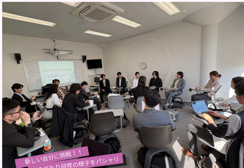
新しい自分に挑戦!! ものがたり研修の様子をパシャリ

2026年4月8日(水)に、東京日仏学院にて「ものがたり研修」を開催しました。今年のテーマは「相互理解」と「自己開示」。新メンバーを含め、一人ひとりが自身の価値観や将来のビジョンを共有しました。会場には互いの想いに真剣に向き合う熱量が溢れていました。