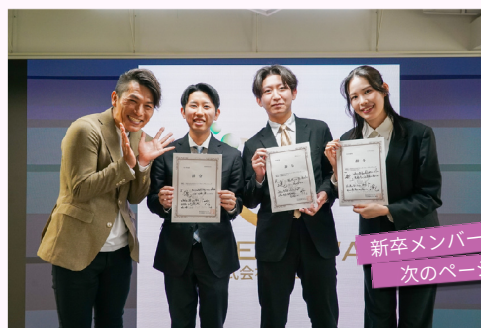
新卒メンバーの意気込みは 次のページへ!

同日、オフィスにて2026年度入社式を開催!! これから始まる社会人生活への期待や覚悟、そして新たな仲間を迎える喜びが会場全体に広がり、チエノワとして新しい一歩を踏み出す瞬間でした。